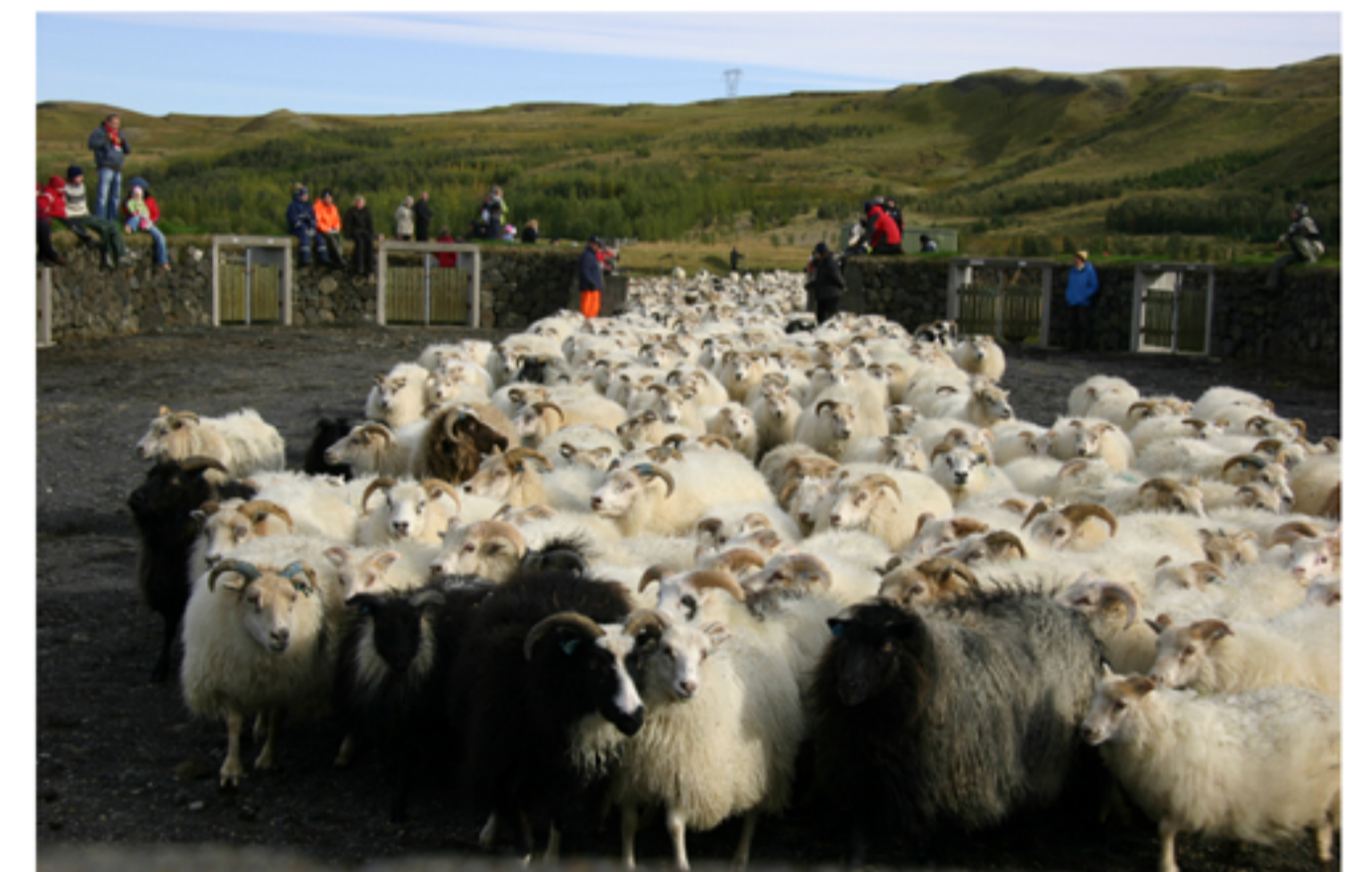
It is always a memorable sight to see long droves of sheep heading down to the lowlands from the upland areas. They are driven into communal corrals, in Icelandic called "réttir".