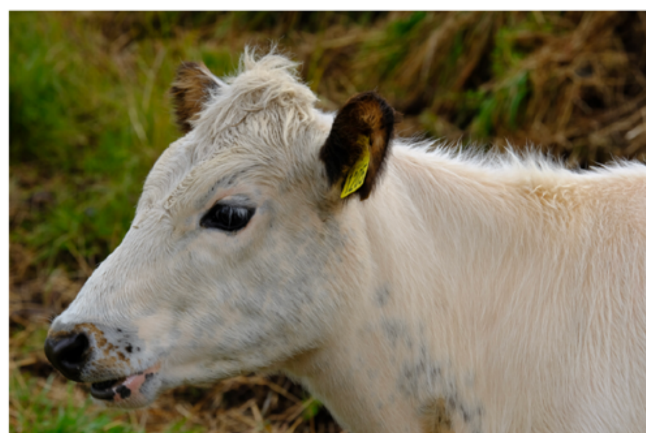
A white calf, a rare colour variety

Artificial insemination with deep-frozen semen is used in practically all herds since around 1970. Production records are kept for 99% of the cow population and are collected into a digital database "Huppa" since 2008. Almost all milk production in Iceland takes place on farms that keep records in Huppa.